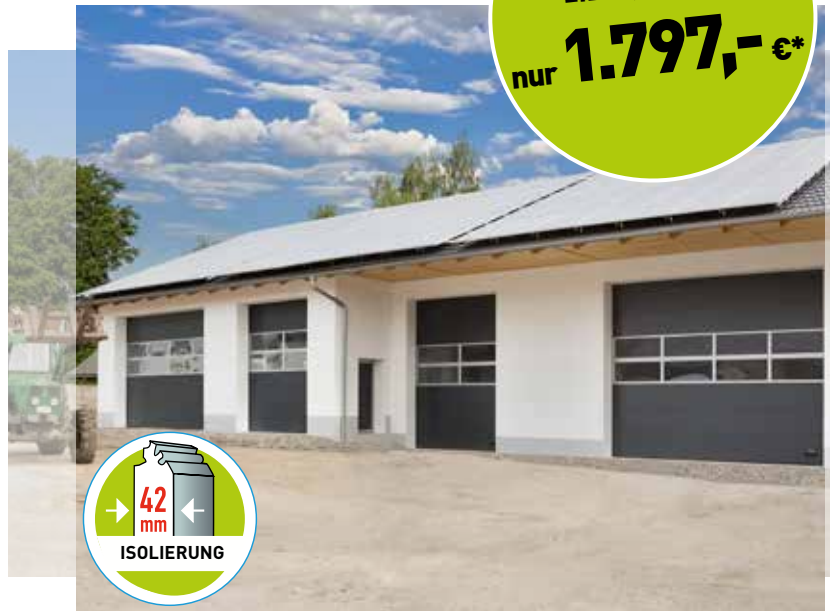
*Symbolfoto, Preis ohne Lichtband